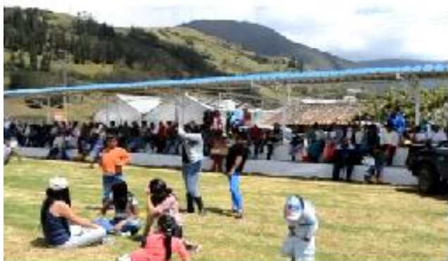
Graderíos del Estadio 5 de Diciembre