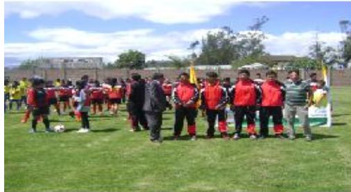
Seleccionados de la parroquia Emilio María Terán