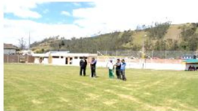
Camerinos del Estadio 5 de Diciembre

El GAD Parroquial de Emilio María Terán gestionó con el gobierno municipal del cantón la construcción de cerramiento, viseras y camerinos en el estadio 5 de diciembre cuyo monto aproximado de 46000,00 dólares.