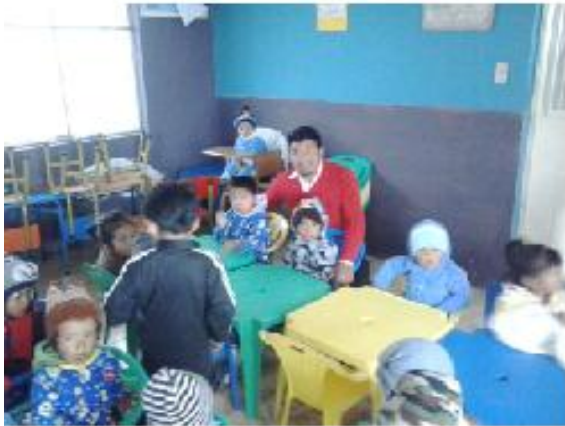
Niños y niñas en el CIBV

El gobierno parroquial a invertido en los Centros Infantiles del Buen Vivir (CIBV) una cantidad de 1436,72 dólares con la finalidad de mejorar las condiciones de este sitio de acogimiento.