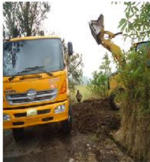
Maquinaria del Gad Municipal de Pillaro

Se gestionó con el GAD Municipal del Cantón Pillaro la maquinaria para la limpieza de las vías para el sector de saguancocha Juanillo, entre otros.