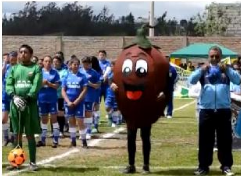
Inauguración Juegos Interparroquiales 2015

La parroquia Emilio María Terán fué sede de los cuartos juegos interparroquiales del cantón Pillaro, con orgullo y alegría los ciudadanos y ciudadanas lograron disfrutar de este evento emblemático.