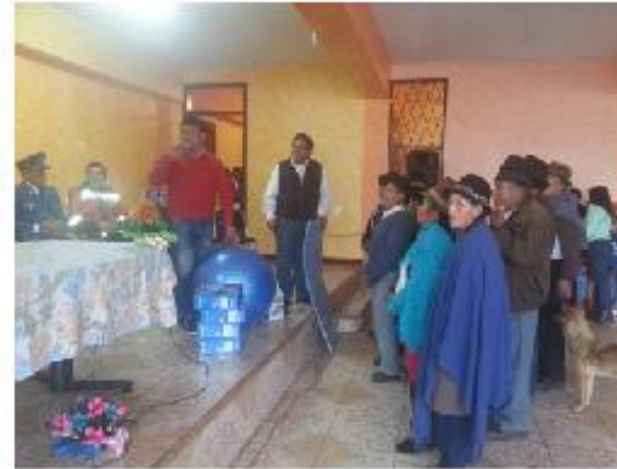
Entrega de implementos

En una de las obligaciones que tiene el Gad parroquial es la atención de los grupos vulnerables, es por eso que se compró implementos, se realizaron giras y se cancelo el pago al médico quien les daba asistencia médica.