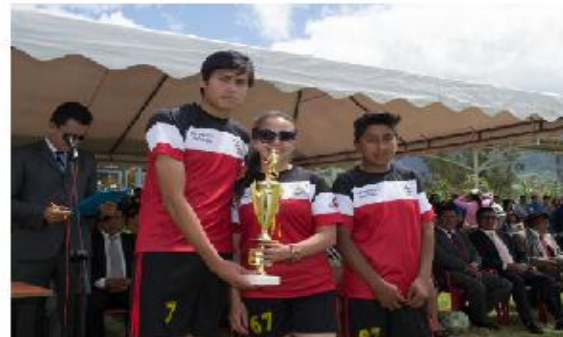
La Delegación de la parroquia Emilio María Terán fué electa mejor mejor uniformada.

El Gobierno Parroquial para la coordinación y ejecución de los Juegos Interparroquiales “Emilio María Terán – 2015 – 2016” invirtió la cantidad de 11312,05 dólares por concepto de uniformes, implementos deportivos, trofeos y medallas.