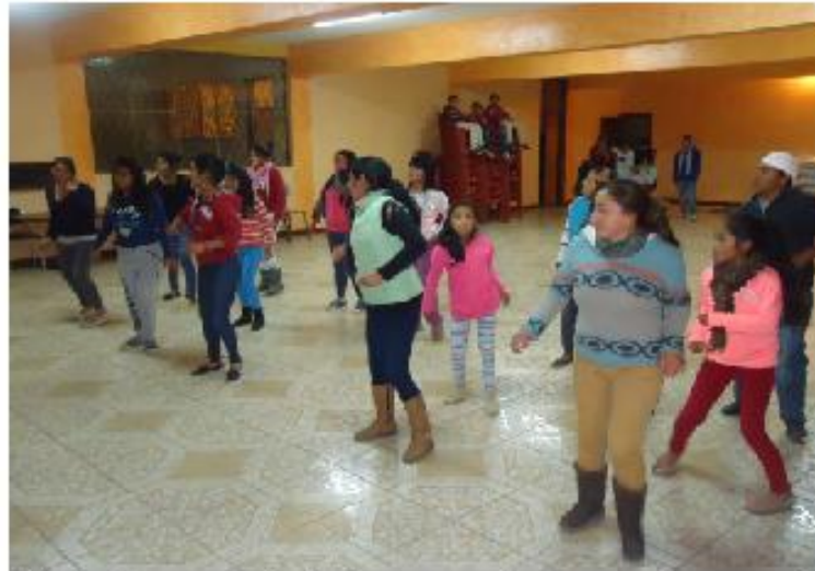
Ciudadanas y ciudadanos realizan rumba terapia

En este segundo año de gestión con el objetivo de impulsar los buenos hábitos y que la ciudadanía realice alguna actividad física, se realizó varios encuentros en las instalaciones del gobierno parroquial en este caso fué la rumba terapia.