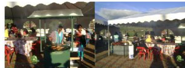
Productores ofertaron sus productos

En el segundo año de gestión se ha realizado tres expo ferias con un valor total de 6017,82 dólares con el objetivo de apoyar al sector productivo de la parroquia.