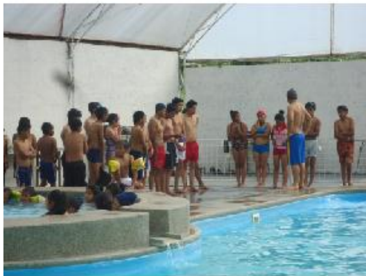
Cursos vacacionales de natación

Como parte de las competencias que tiene el gobierno parroquial es fomentar el deporte, en esta ocasión se desarrollo cursos vacacionales con la modalidad de natación.