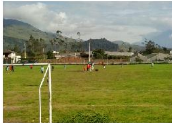
Estadio 5 de Diciembre

El Gad parroquial en la escuela de futbol en este año 2015 por concepto de profesores se ha cancelado un valor de 8009,72 dólares.