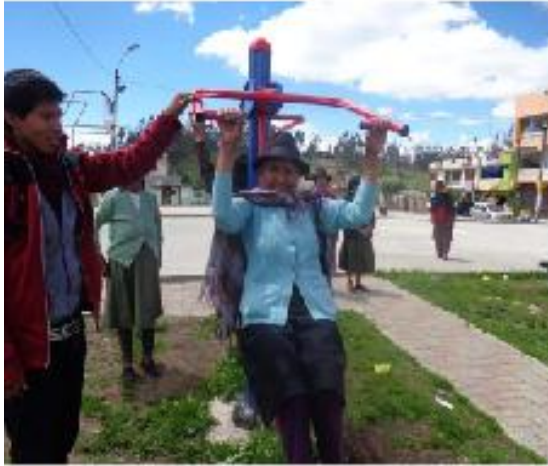
Terapias Adultos Mayores