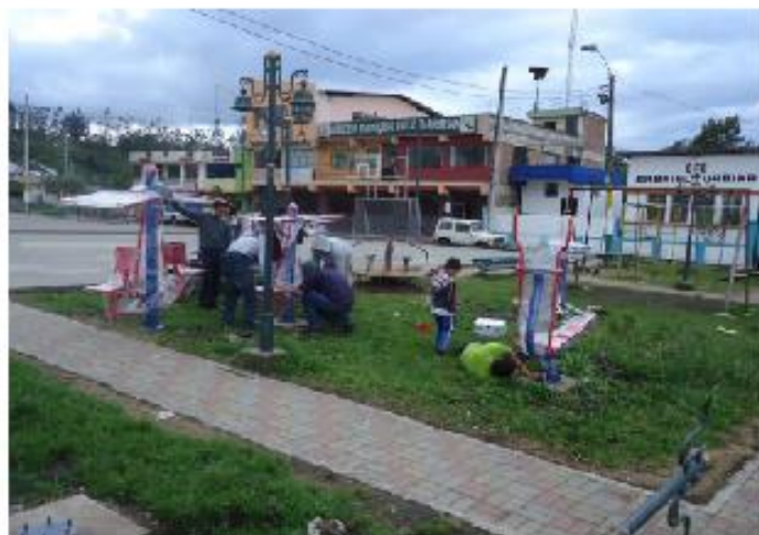
Máquinas de ejercicio

La comisión de Cultura, Recreación y Deporte con el fin de incentivar a los habitantes que hicieran deporte se implementó algunas máquinas para hacer ejercicios especialmente terapéuticos.