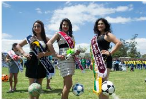
Elección de la Srta, Deportes de los cuartos juegos interparroquiales 2015 - 2016